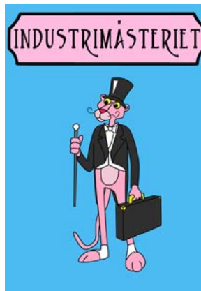
Bilden ovan är skapad av D-sektionens artist i anledning av sektionsafariten 2004.

För tillfället saknar vi en artist. Känner du att posten skulle passa dig så kontakta propagandamästeriet.